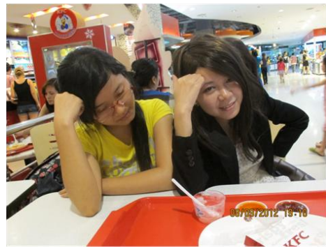
Tác giả, mặc áo đen, bên phải

Tuy nhiên, không giống như thị trường chứng khoán Việt Nam, nhà đầu tư chỉ có thể kiếm lời với một chiều đi lên; với thị trường ngoại hối, nhà đầu tư có thể kiếm lời với cả hai chiều lên và xuống. Nếu nhà đầu tư mua một mã cổ phiếu nào đó, khi cổ phiếu giảm giá trị, nhà đầu tư bị thua lỗ, để dừng việc thua lỗ nhà đầu tư phải bán cổ phiếu đó đi. Còn đối với thị trường Forex, giao dịch theo từng cặp tiền tệ, nếu đồng tiền này giảm xuống, điều này chỉ có nghĩa là đồng tiền còn lại đang mạnh lên. BUY và SELL trên thị trường Forex chỉ là quy ước cho chiều lên và chiều xuống, chứ không có nghĩa là lệnh SELL là mua rồi bán ra như thị trường chứng khoán