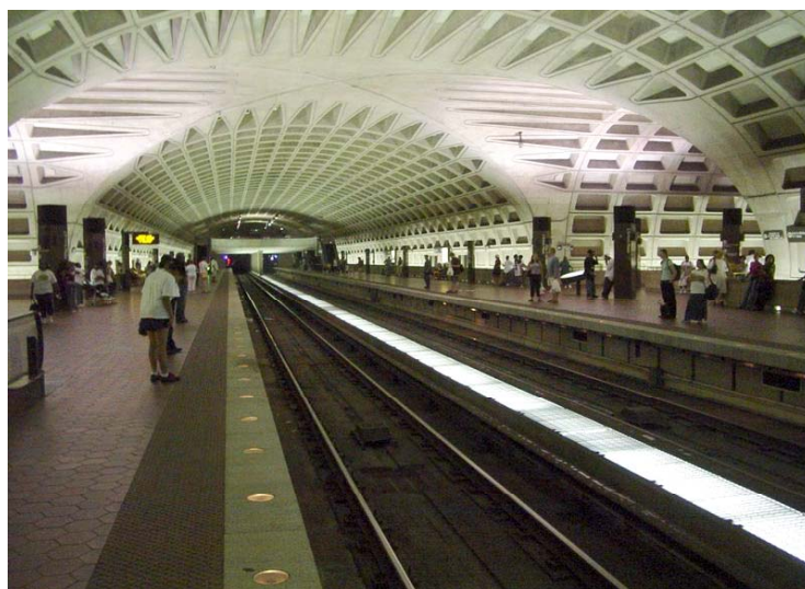
Nhà ga L'Enfant Plaza