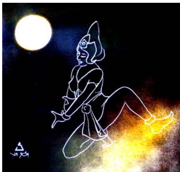
Vũ điệu Chăm pa

Khác ở chỗ tôi chỉ dùng một cây viết có mũi nhọn làm công cụ lấy ra phần vật liệu nền không cần thiết và vật liệu nền là giấy cứng được xử lý đặc biệt, những thứ này đều có giá thành không cao, do vậy chi phí cho việc tạo ra một bức tranh là rất thấp. Còn về những mặt khác thì cũng giống như điều khắc.