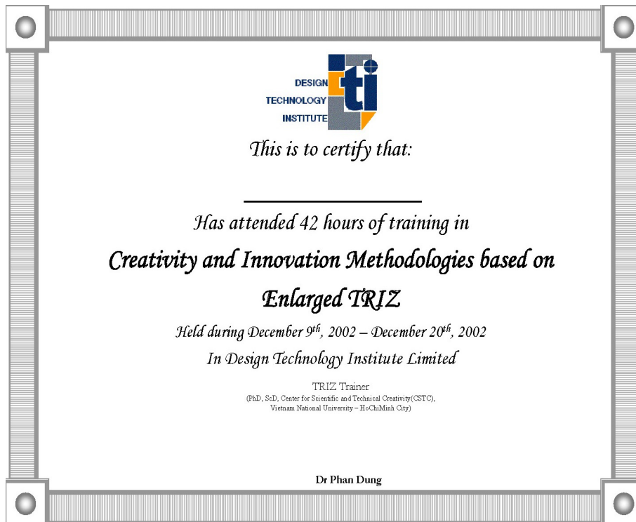
Mặt trước giấy chứng nhận

Giấy chứng nhận cấp cho các học viên PPLST là các cán bộ giảng dạy, nghiên cứu tại Học viện công nghệ thiết kế (Design Technology Institute) tại Singapore.